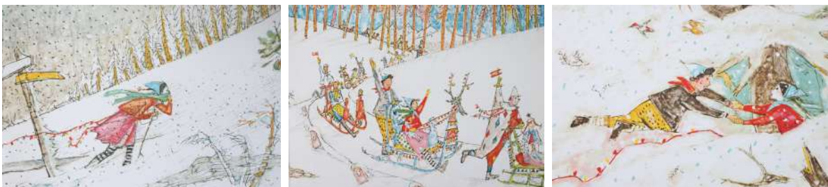
D'après le livre pour enfants "DER GROSSE SCHNEE", d'Alois Carigiet (Illustration) et Selina Chönz (texte), paru aux éditions Orell Füssli © 1971 Orell Füssli AG, Orell Füssli Verlag Zürich. Tous droits réservés.

Dans un décor qui s'inspire du monde coloré et merveilleux des dessins de Alois Carigiet, quatre comédiennes et comédiens racontent dans un récit choral cette histoire simple et riche, dont la trame évoque les relations entre les sœurs et les frères, entre les générations, entre la nature et l'être humain.